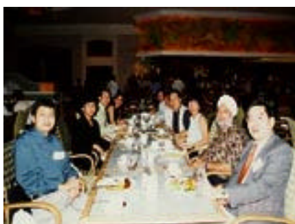
美食當前，當然要拍照留念呢！

經過一天忙碌的工作，我們在香格里拉大酒店款待新加坡四間學校的校長及副校長，一起享用豐富的自助晚餐，食物種類包羅萬有：生蠔、魚生刺身、沙嗲、芝士蛋糕...一應俱全。