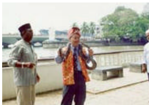
翁校長與蛇合照，仍能神態自若，看來校長「舞蛇」確有一手！

行程最後一天，終於完成了四間學校的參觀的活動。同事們當然不會放棄每分每秒的時間，作最後衝刺大購物，為家人及同事們買些手信啦！除此之外，去到新加坡當然不能少的指定節目——魚尾獅像前留倩影，否則又怎算到過新加坡一遊！