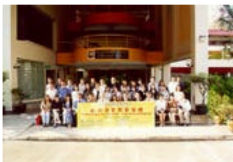
於德明中學前留倩影

本年三月二十日，會屬學校包括圓玄一中、圓玄二中、圓玄三中及青松中學的校長及老師，一行數十人齊集香港國際機場浩浩蕩蕩地出發前往新加坡，開展為期四天的新加坡教育交流之旅。雖然行程只有短短的四天，但我們已參觀過知新館及到訪過當地四間成績卓越的中學：德明中學、聖公會中學、文殊中學及實仁中學，這四間中學都各具特色，真令我們一眾校長及老師獲益良多。