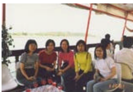
老師們於船上來一個合照

本年三月二十日，會屬學校包括圓玄一中、圓玄二中、圓玄三中及青松中學的校長及老師，一行數十人齊集香港國際機場浩浩蕩蕩地出發前往新加坡，開展為期四天的新加坡教育交流之旅。雖然行程只有短短的四天，但我們已參觀過知新館及到訪過當地四間成績卓越的中學：德明中學、聖公會中學、文殊中學及實仁中學，這四間中學都各具特色，真令我們一眾校長及老師獲益良多。