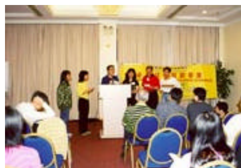
大家熱烈期待的有獎問答時間

首項工作正式開展 工作簡介會。當然，在正式討論分工前，大家先來熱熱身，進行有獎問答比賽，令各同工精神一振，熱烈投入。