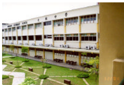
廣闊的校園，學生 有足夠的活動空間