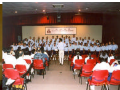
學生的精采表演 令人嘆為觀止