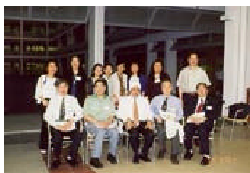
看！天尚未光，我們便已展開工作了

由旅程第二天至第四天，我們都馬不停蹄地到不同學校參觀考察。雖然差不多每天大家都需要於大清早起床，但我們的同工仍能裝扮整齊，精神抖擻地準時集合。