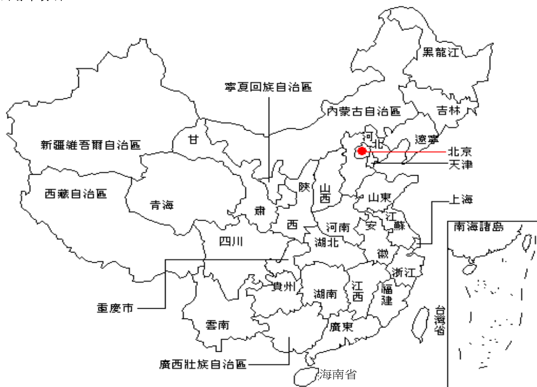
認識中國系列-地理及政制_CDRom(教育署課程發展處人文學科組)